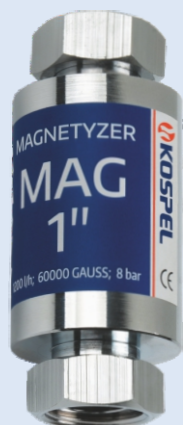
Magnetyzer MAG 1"

Zapobiegają osadzeniu się kamienia kotłowego w instalacjach wodnych. Pracują bezobsługowo i bez kosztów eksploatacji.