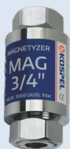
Magnetyzer MAG 3/4"